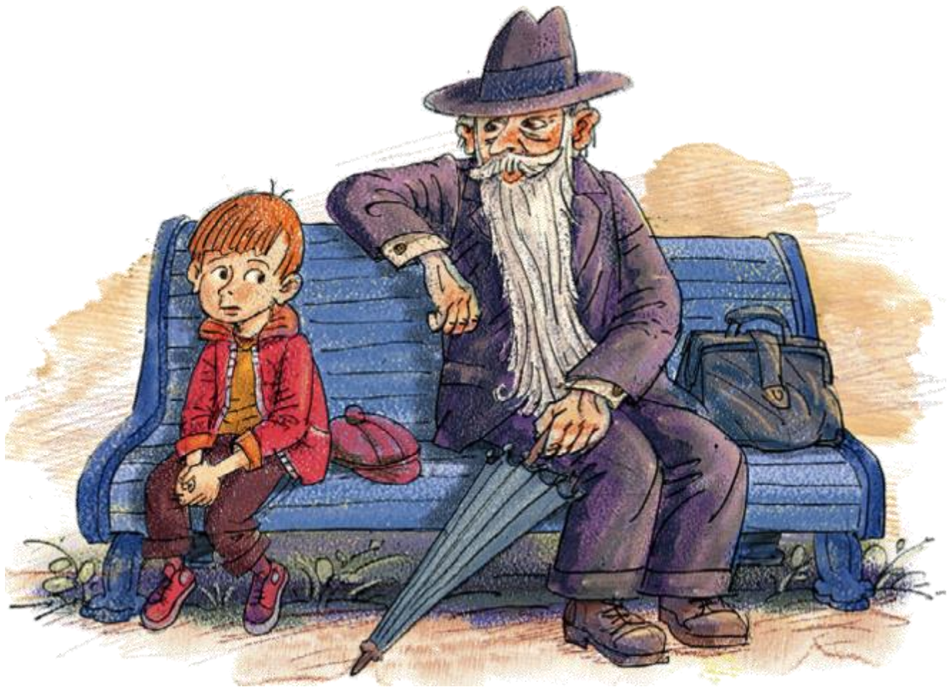
Рисунок можно нарисовать самостоятельно, вот примеры рисунков, которые были нарисованы детьми. Старичка нужно нарисовать с седой бородой и зонтом.